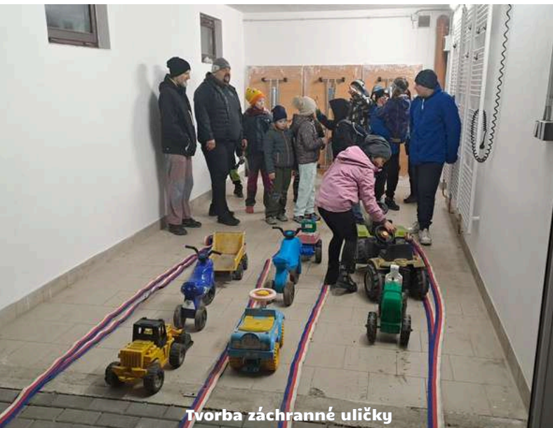
Tvorba záchranné uličky

Se začátkem nového školního roku se po prázdninové přestávce znovu rozběhly kroužky mladých hasičů. Schůzky probíhají ve středu v lehce pozměněných časech – příprava od 15:45 do 16:45, dorost od 17:00 do 18:00. Protože mladí hasiči nejsou žádná „ořezávátka“, probíhá většina schůzek i v současném chladném počasí venku. Pro představu co vše se v rámci kroužku trénuje, lze uvést třeba věc, se kterou má problém i leckterý dospělý – tvorba záchranné uličky na víceproude silnici.