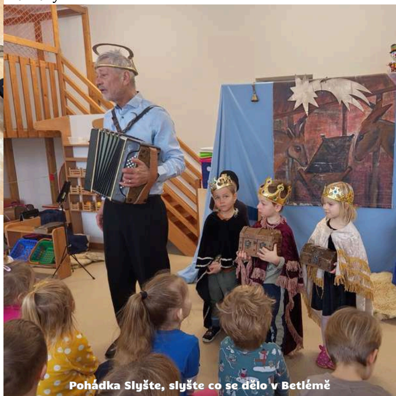
Pohádka Slyšte, slyšte co se dělo v Betlémě

Děkujeme všem rodičům za účast a podporu při našich akcích. Jsme rádi, že společně vytváříme příležitosti, které posilují spolupráci rodiny a školy a přináší dětem radost i nové zážitky.