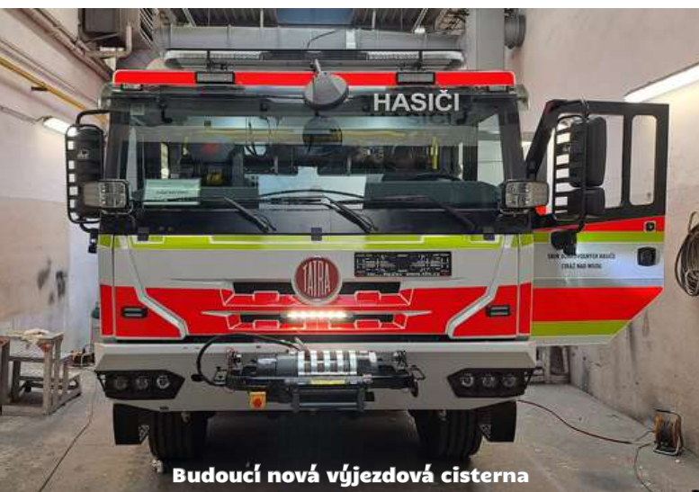
Budoucí nová výjezdová cisterna