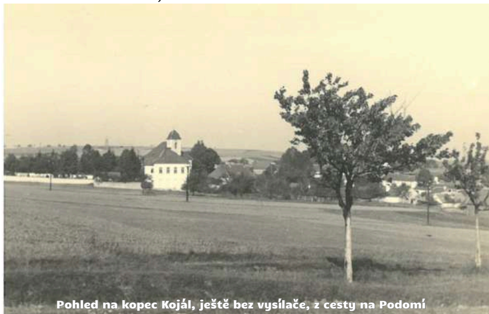
Pohled na kopec Kojál, ještě bez vysílače, z cesty na Podomí

Neznámý kopec vévodící jižní části Dražanské vrchoviny se na konci padesátých let 20. století stal evropským pojmem, neboť na jeho vrcholu, který protíná hranice okresů Vyškov a Blansko, vyrostla 322,4 m vysoká ocelová konstrukce nosiče anténních systémů televizního vysílače pro celou oblast jižní Moravy. Tato konstrukce byla delší dobu nejvyšší stavbou Evropy a známá Eiffelovka v Paříži se musela spokojit pouze s druhým místem. Nevídaná stavba montovaná pomocí šplhavé kaliny z dílů o výšce 11,25 m a kotvená pouze dvanácti lany - rovněž neobvyklé konstrukce - nesplétanými dráty o průměru 4 cm - se stala cílem turistů a náhodně projíždějících i lidí z blízkého a vzdálenějšího okolí.