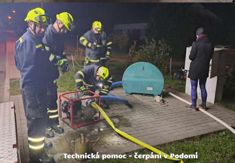
Technická pomoc - čerpání v Podomí