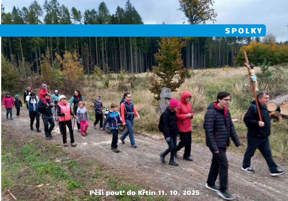
Pěší pout' do Křtin 11. 10. 2025