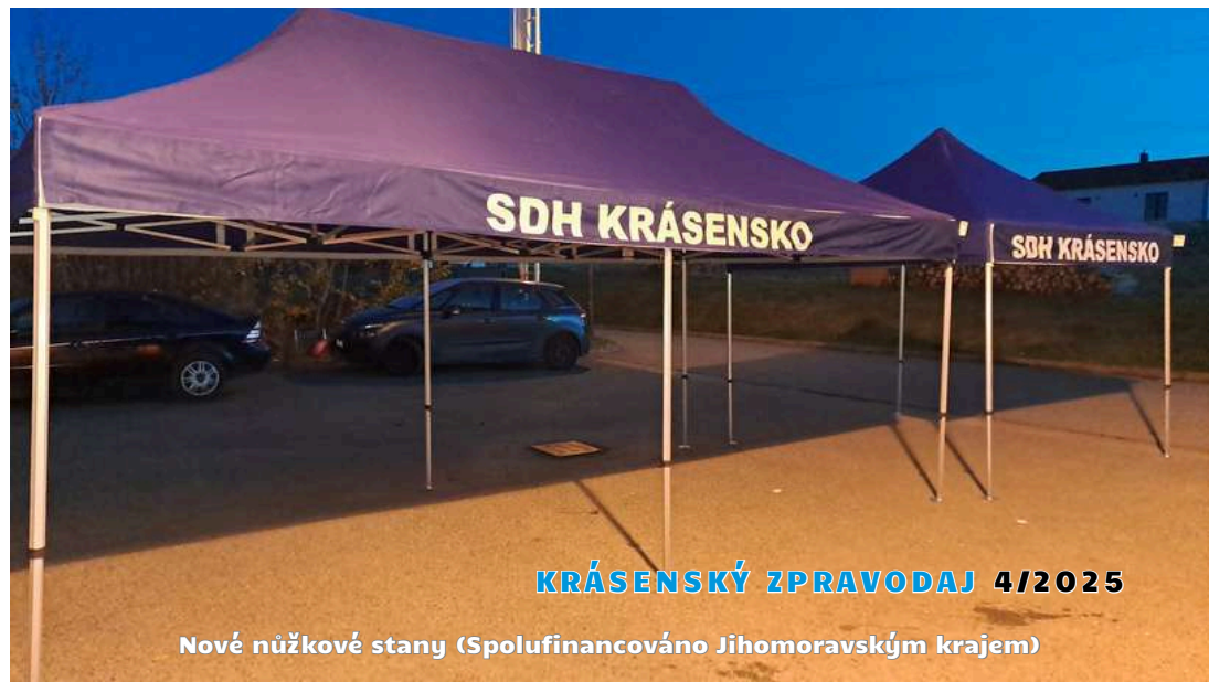
Nové nůžkové stany (Spolufinancováno Jihomoravským krajem)

Zásahová jednotka se mimo pravidelné odborné přípravy a ostrých zásahů, věnovala poměrně netradiční, ale velice příjemné činnosti – sestavní konfigurace nové výjezdové cisterny, která by k nám do obce měla dorazit cca do 2 let. Financování pro takto velkou akci se podařilo zajistit z velké části z dotačních programů ministerstva vnitra a jihomoravského kraje. Díky dlouhodobé průběžné modernizaci výzbroje a výstroje z rozpočtu obce a dílčích dotačních titulů, máme spoustu potřebných položek povinného vybavení k dispozici už nyní, díky čemuž ušetříme u takto velké akce více jak 10% nákladů.