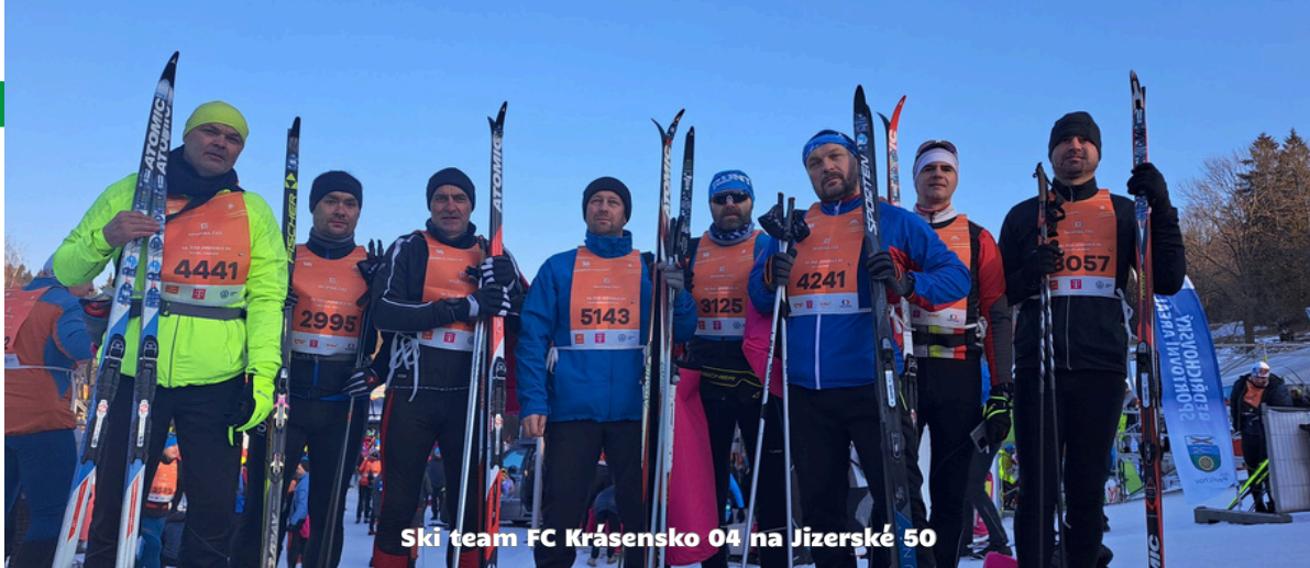
Ski team FC Krásensko 04 na Jizerské 50