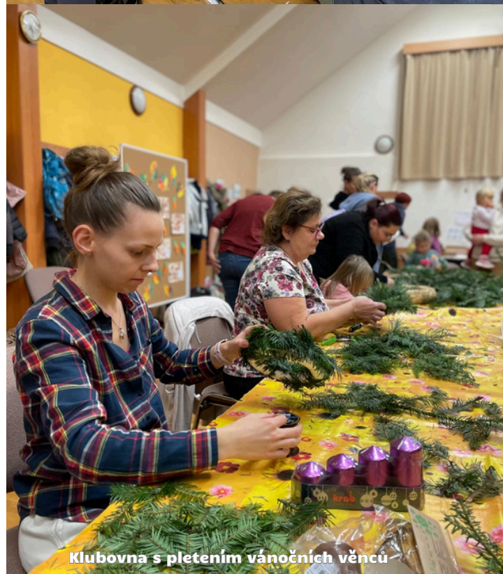
Klubovna s pletením vánočních věnců