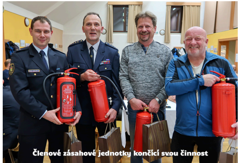
Členové zásahové jednotky končící svou činnost