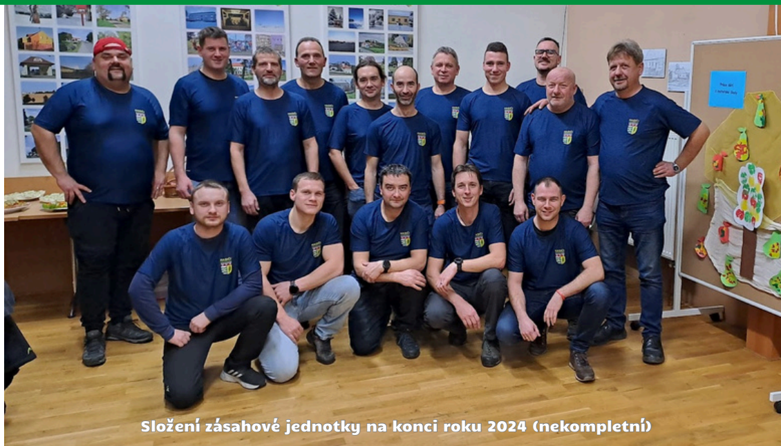
Složení zásahové jednotky na konci roku 2024 (nekompletní)