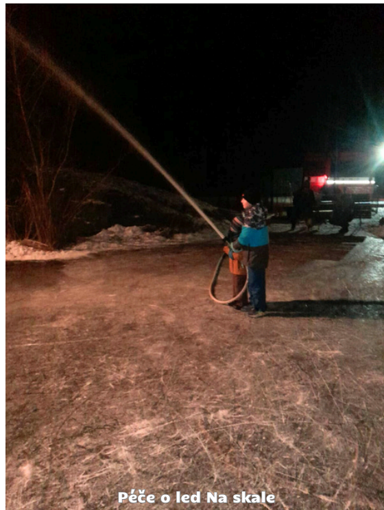
Péče o led Na skale

Když to počasí dovolilo, proběhly některé hasičské schůzky také na skale, abychom využili ledu a děti si mohly zabruslit. I tuto aktivitu jsme však doplnili jednak o vzdělávání na téma „záchrana na ledu“ ale také o samotnou péči o led, kdy si sami mladí hasiči led zametli a zajistili políť vodou, aby na další dny byl led připraven.