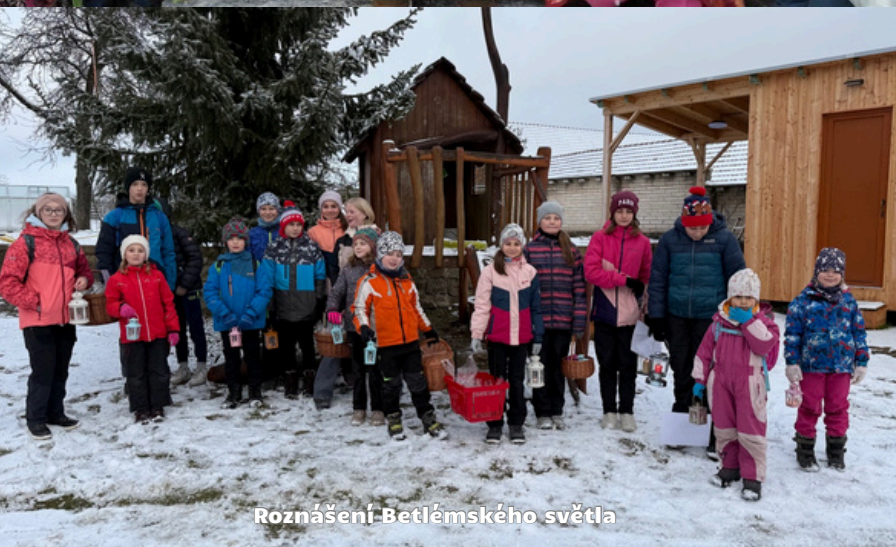
Roznášení Betlémského světla